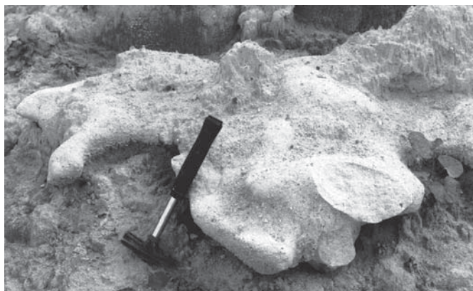
7. ábra Meszes kötőanyagú homokkő konkréciónak a 187 m-es szint bányauzárási Fig. 7. Lime-bonded sandstone concretion in the quarry-yard at the elevation 187 m

A bányaföldtani szelvényezések, tapasztalatok alapján a produktív homokösszlet nagyobb áteresztő képességű részein áramló oldatok meszkiválásaiából a bányauzem több szintjén mutatkoznak változatos alakú, esetenként bizarr formájú homokkő konkréciónak (6–7. ábra). A meszes kötőanyagú konkréciónak nem minden bányaművelési szinten mutatkoznak azonos gyakoriságban és mértékben. A 187 m-es szinten (Balti felett) a homokkő konkréciónak padokká álltak össze (8. ábra), míg a magasabb szinteken csak elszórtan fordulnak elő a produktív homokösszletben.