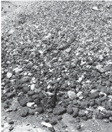
10. ábra Mosás, osztályozás során leválasztódott, minőségileg alkalmatlan, barna, limonitos homokkő gumók

helyenként kötöttebb limonitos homok, homokkő mosás után a kötöttség fokának függvényében a leválasztott, minőségileg alkalmatlan, dominálónan mészkonkréciókból álló halmazban, vasas gumók formájában látható viszont (10. ábra).