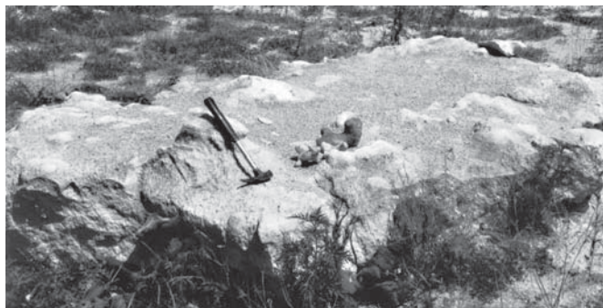
8. ábra Meszes kötőanyagú homokkőpad a 187 m-es szint bányauzárási Fig. 8. Lime-bonded sandstone bench in the quarry-yard at the elevation 187 m

A produktív földpátos homok fedőjét képező pleisztocén, holocén üledékek vastagsága 1–6 m között változik. Vertikális kiterjedése délkeleti irányba mutat növekvő tendenciát. A fedő kőzetanyaga lösz, homok, kavics és egyéb kőzettörmelék: mészkő, márga, homokkő. A 2007 és 2008-as évek bányaművelése folyamán a fedőt alkotó, felül erősebben humuszos termőtalaj vastagsága csak kis mértékben haladta meg az 1 métert.