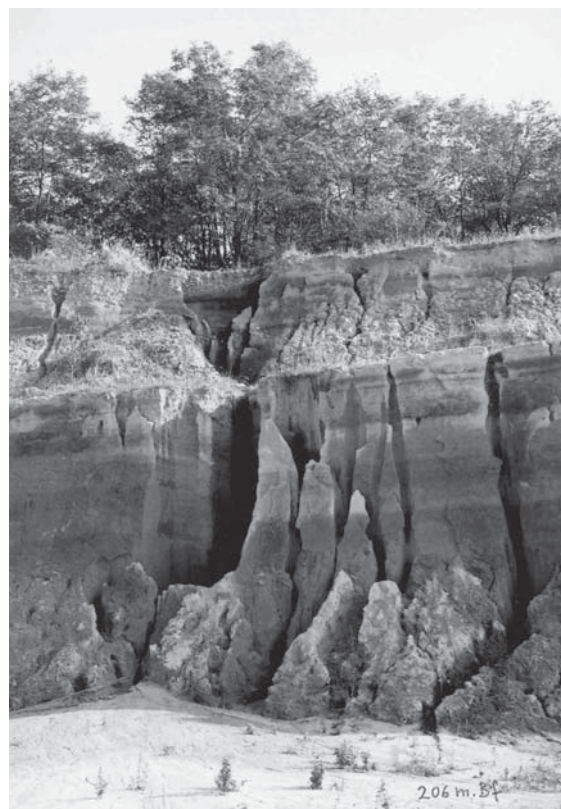
5. ábra Csapadék okozta vízbemosások a délkeleti bányafalalon Fig. 5. Precipitation caused traces of water-flows on the southeastern quarry wall

jobb ellenálló kvarc és földpát tartalmú gránitmurva. Ami aztán a szállítódás következtében tovább aprózódva rakódott le az alacsonyabban fekvő területeken. Ezen földtani folyamat eredményeképpen halmozódhatott fel a felső-pannoniai beltóban az akkor még kiemelkedtebb helyzetű mórággyi gránitterület mállásterméke a földpátos homok. A Mecsek-hegység előterében levő pécsváradai homok dőlése 10–15° délkelet irányban, ami a mecseki mezozoos karbonátos tömb pannoniai emelet utáni fokozatos kiemelkedésével magyarázható. A homokrétegek bányafalokon mutatkozó kisebb dőlésszög eltérései az üledékképződés közbeni epirogenetikus mozgások hatására fellépő tőfenék ingadozások következményei.