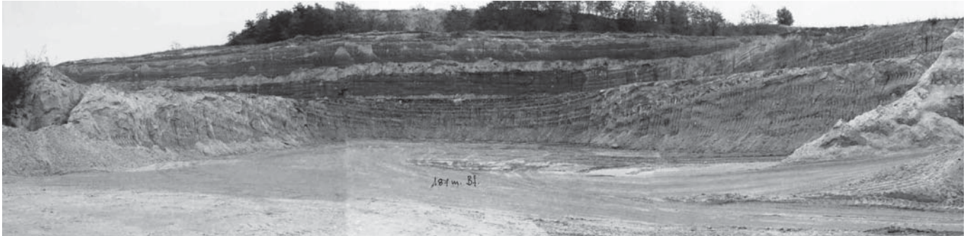
9. ábra Rétegdőlés irányába művelt bányafal az üzem délkeleti részén

Fig. 9. Quarry-wall worked in the direction of the dip of strata at the southeastern part of the mining works