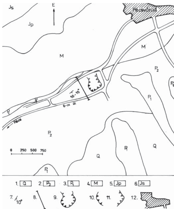
1. ábra Vázlatos helyszínrajz és földtani térkép

A KÓKA Kavicsbányászati Kft. Mecseki Bányüzemek kezelésében lévő pécsváradi földpátos homokot termelő bányüzem a Keleti Mecsek délkeleti előterében, Pécsvárad településtől mintegy 1 km távolságra a 6-os számú főút mellett található (1. ábra).