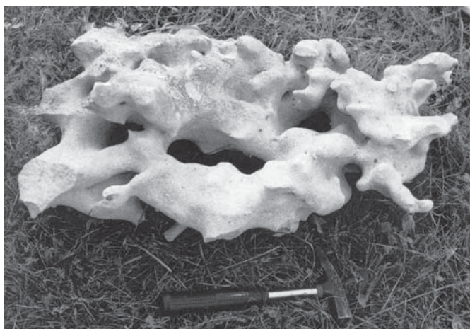
6. ábra A földpátos homokból kimosódott bizarr formájú, meszes kötőanyagú homokkő konkréciónak (mérete: 70 × 40–50 cm) Fig. 6. Lime-bonded sandstone concretion of a bizarre form washed out from the feldspar-containing sand (size: 70 × 40–50 cm)

A pécsváradi homokbánya legfelső szintjén a homokrétegek már vízszintesen települnek, ami azt jelzi, hogy ezen üledékrétegek lerakódása után már nem volt az üledékrétegeket megbillentő epirogenetikus mozgás, mint a mélyebben levő szintek homokrétegeinek képződésekor, illetve azt követően.