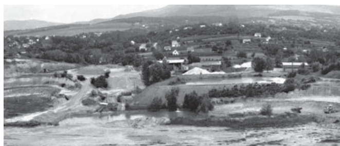
2. ábra A pécsváradi földpátos homokbánya és nyersanyagterülete

jebb az erózióbázishoz közeledve egyre sekélyebb morfológiai alakzatokat képeznek. A Keleti Mecsek délkeleti előterében (Mecsekalja tájegység) levő pécsváradi homokbánya nyersanyagterületének felszíne délkeletre enyhe lejtésű, rajta hirtelen szintkülönbségeket okozó morfológiai alakzatok, markáns kiemelkedés, eróziós völgy, vízbemosás nem mutatkozik (2. ábra).